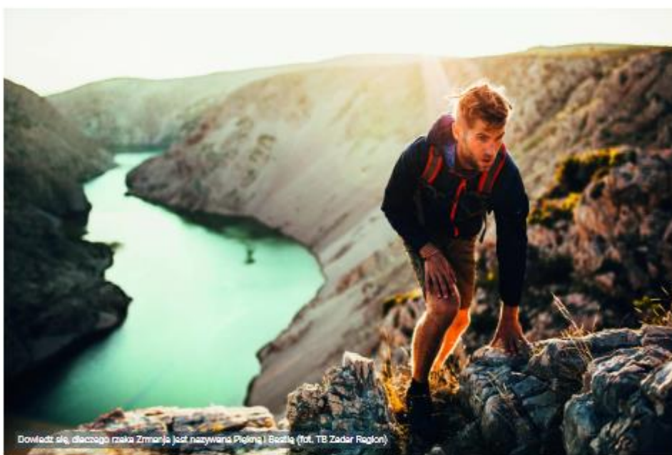
Dowiedz się, dlaczego rzeka Zrmanja jest nazywana Piórną i Bocia!

Na szczególną uwagę zasługuje idylliczne Morze Novigradzkie, którego spokojne i ciepłe wody sprzyjają zabawie i uprawianiu sportów wodnych. Najważniejszym ośrodkiem u jego brzegów jest miasteczko Novigrad, położone na zboczu wzgórza po północno-wschodniej stronie specyficznej zatoki i „chronione” przez fortecę (Fortica) i mury obronne. Novigradzkie i Karinskie wody obfitują w ryby i wybitne okazy muszli, a w szczególności w małże. Koniecznie trzeba tu spróbować lokalnego specjału – doskonałych novigradzkich małży na buzarze, w charakterystycznym, aromatycznym i pełnym słodczy sosie. Z kolei położone po przeciwległej stronie Morza Novigradzkiego miasteczko Posedarje słynie z wyrobu wędzonej szynki zwanej pršut (podobnej do włoskiej szynki parmeńskiej). Będąc w tej okolicy, warto również spróbować tradycyjnie pieczonej, soczystej jagnięciny.