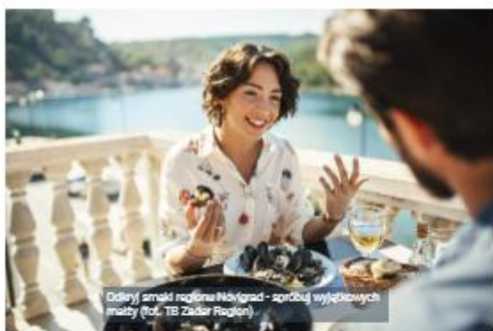
Odliyan smak rajiona Novigrad - spróbuj wyjątkowych małży

Góry opadające niemal bezpośrednio do morza – czy można sobie wyobrazić piękniejszy krajobraz? Świeże powietrze i zapierające dech w piersiach widoki przyciągają co roku w te okolice zarówno wczasowiczów, szukających wytchnienia od natłoku codziennych spraw, jak i poszukiwaczy mocnych wrażeń.